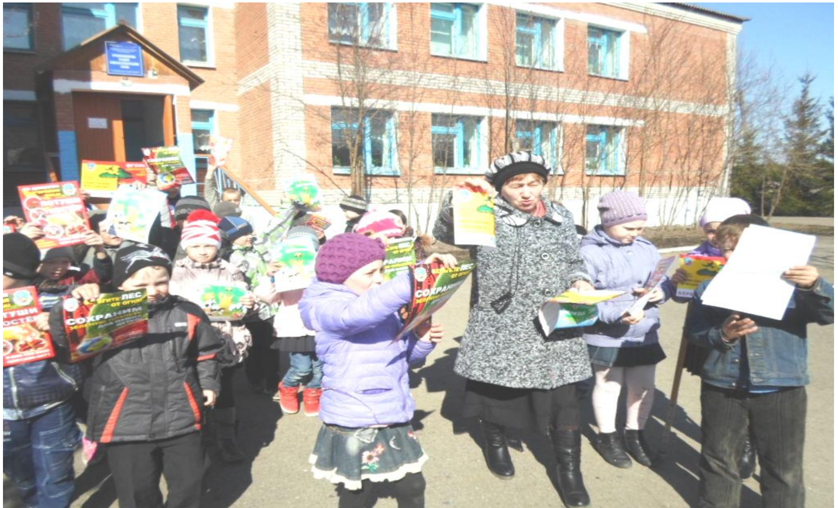
Акция «Сохраним лес от пожара»