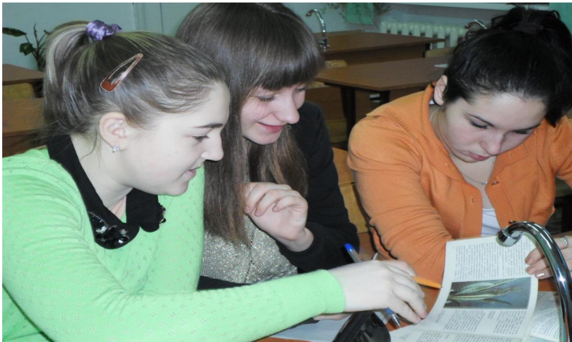
Члены школьного лесничества пишут проект