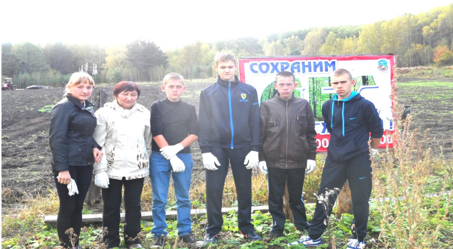
Работа в Краснореченском лесничестве