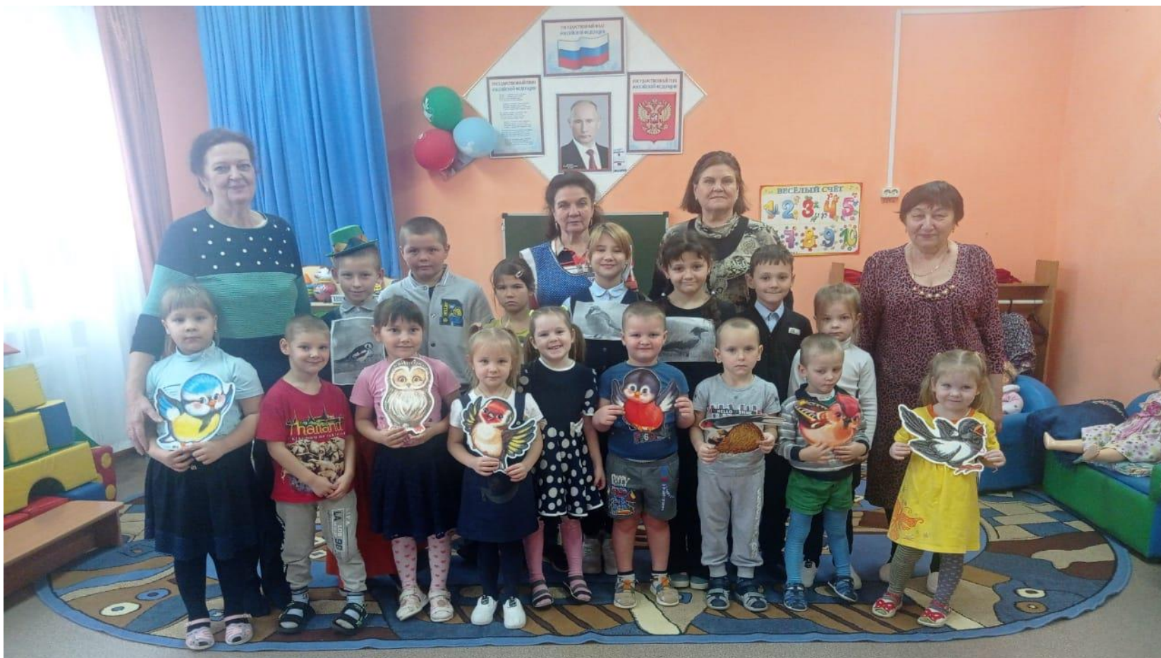
«Синичкин день» в детском саду