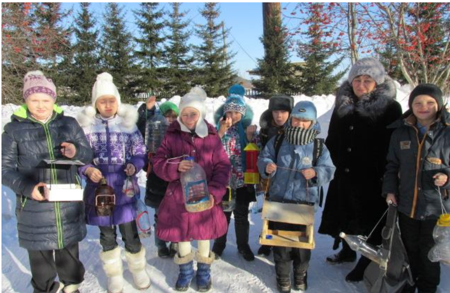
Акция «Покорми птиц»