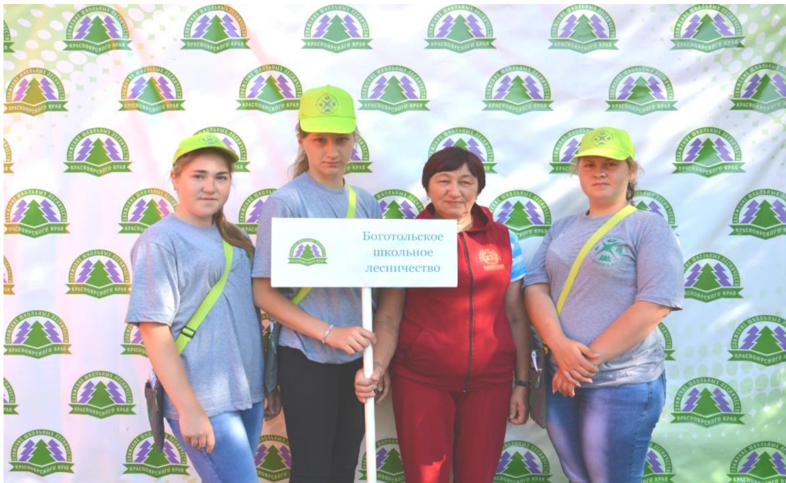
Слёт школьных лесничеств в г.Дивногорске