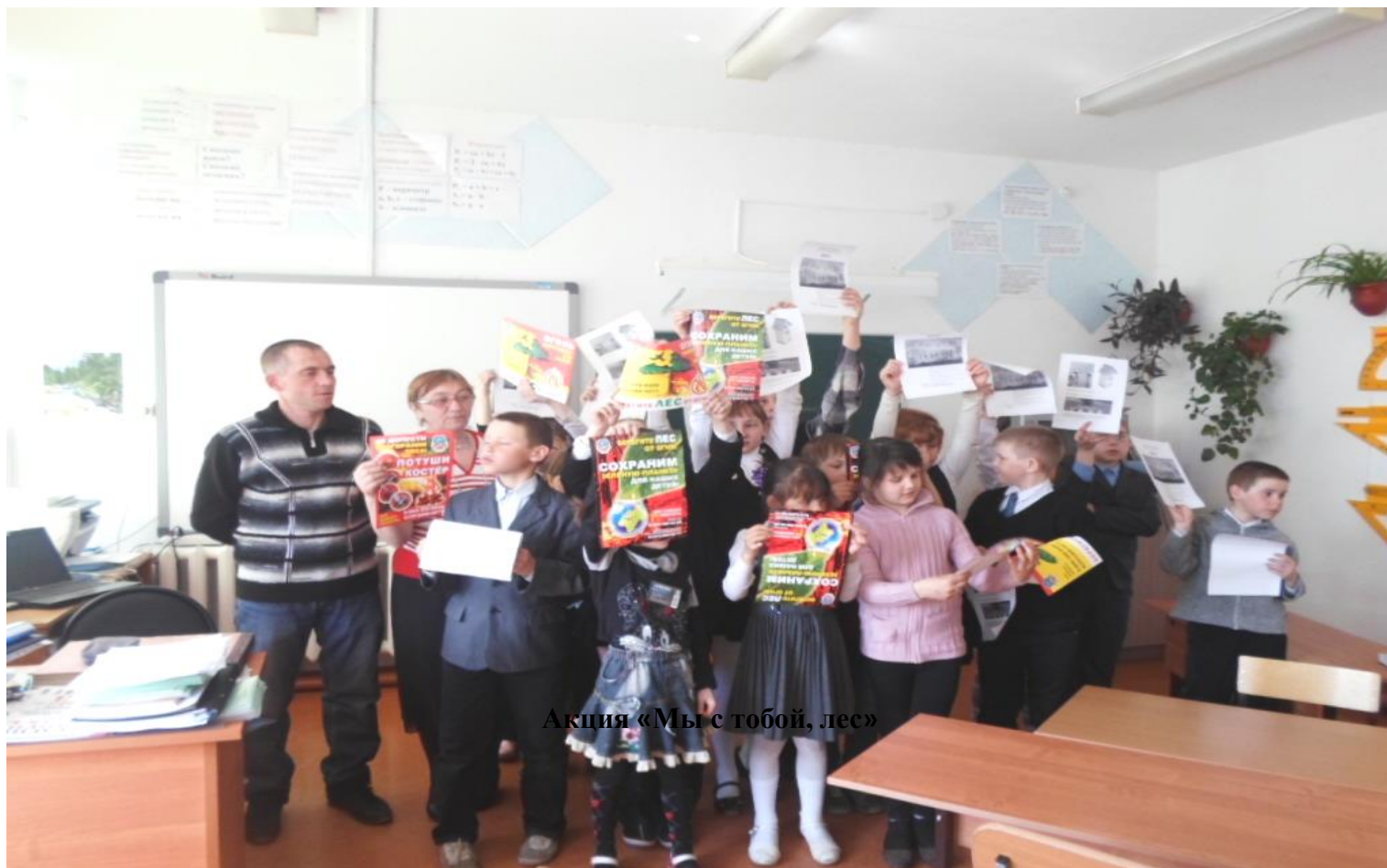
Акция «Мы с тобой, лес»