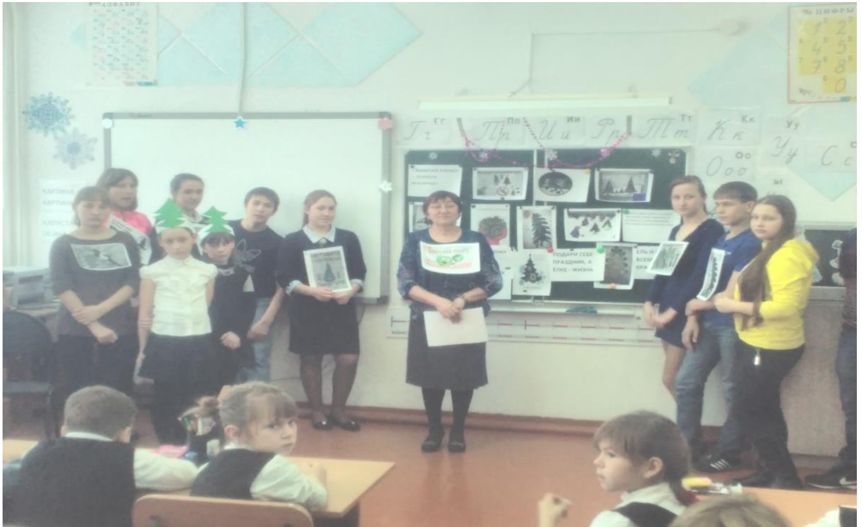
Выступление агитбригады «Эко»